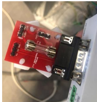
Adapter SUBD V1.2

Der Webserver hat einen DB9-Port. Um die Wartungsbox mit dem Webserver zu verbinden, benötigt man also einen RS232-DB9-Adapter (1A-Sicherung), wie auf folgendem Foto zusehen ist :