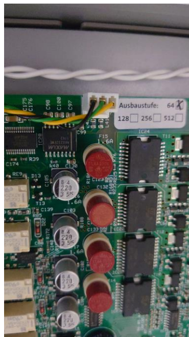
Der Telenot RS232-Ausgang